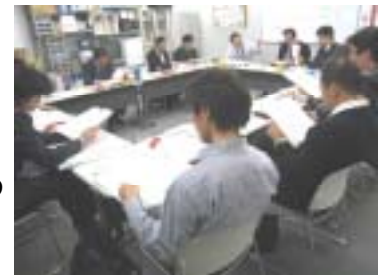
ここで、熱い協議が！！

1月20日にNCCU西日本事務所で第3回常任協議会を開催しました。各分会・地域分会より「現在の活動報告」があり、NCCU本部・近畿支部より「厚生省関係への会議の参加」「家庭に眠るお宝キャンペーン」「専門部体制」について報告がありました。また「第11回 NCCU中央委員会議案内容と支部からの代議員について」「NCCUの今後のあり方についての提案内容」「地域協議会(近畿支部(2府4県)の各都道府県単位で行う活動)」「分会協力行事」「2/26ステップアップセミナー」など今後の活動について熱い協議が行われました。